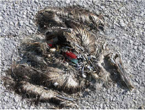
ミッドウェー環礁のコオキノタウウ(コアホウドリ)のヒナの死骸ほとんどの死骸からプラスチックが見つかる