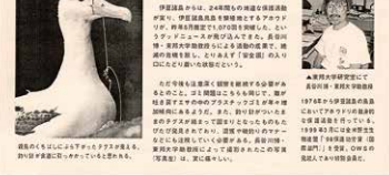
伊豆諸島からはアホウドリ保護活動の成果