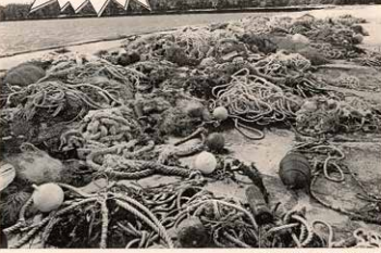
北に積み上げられた111トンにも及ぶゴミと漁網