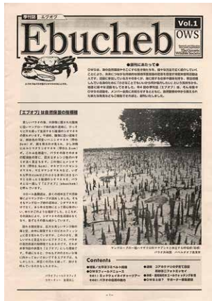
エブオブ創刊号表紙