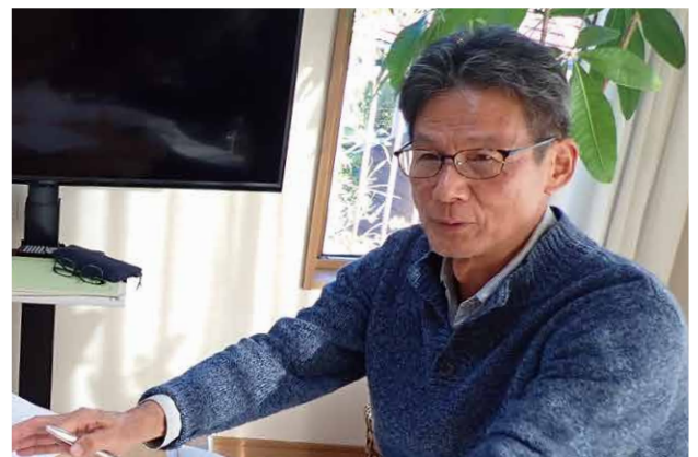
横山代表理事「やっぱり現場での活動は大切にしたいですね」